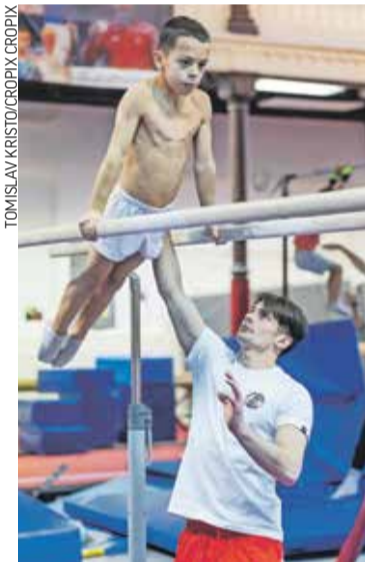
Nove generacije talentirane djece potvrđuju da sokolaši i dalje idu pravim putem

U vremenima kad mnogi kulturni, sportski ili društveni simboli nestaju ili se nalaze pred gašenjem jer iz raznih razloga više ne mogu pratiti korak s modernim svijetom, trajati punih 150 godina i biti živahniji i bolji nego ikad - to mogu samo posebni. Zagrebačko tjelovježbeno društvo Hrvatski sokol sljedeći će tjedan na svečanosti u svome Sokolskom domu proslaviti upravo 150. rođendan, što je itekako impresivna brojka, pogotovo kad se uzme u obzir da se iza nje krije djelovanje unutar nekoliko država, političkih sustava i ratova. Sve su to sokolaši preživjeli, znali su se dočekati na noge i u najtežim danima i danas se s ponosom mogu hvaliti da su najstarije aktivno sportsko društvo u Hrvatskoj.